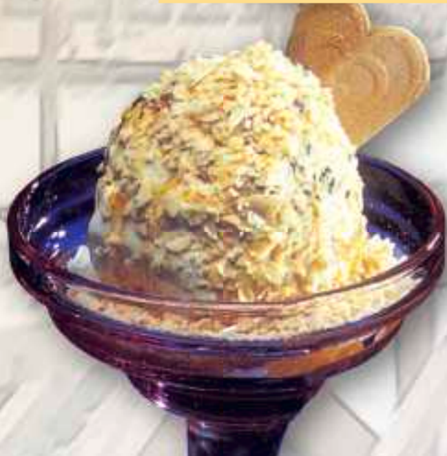
50. Raffaello 8,00 € große Vanille-, Stracciatellaeiskugel, mit Zabajonelikör gefüllt, Vanillesauce, übergossen und weißer Schokolade bestreut, mit Sahne 1-5-6