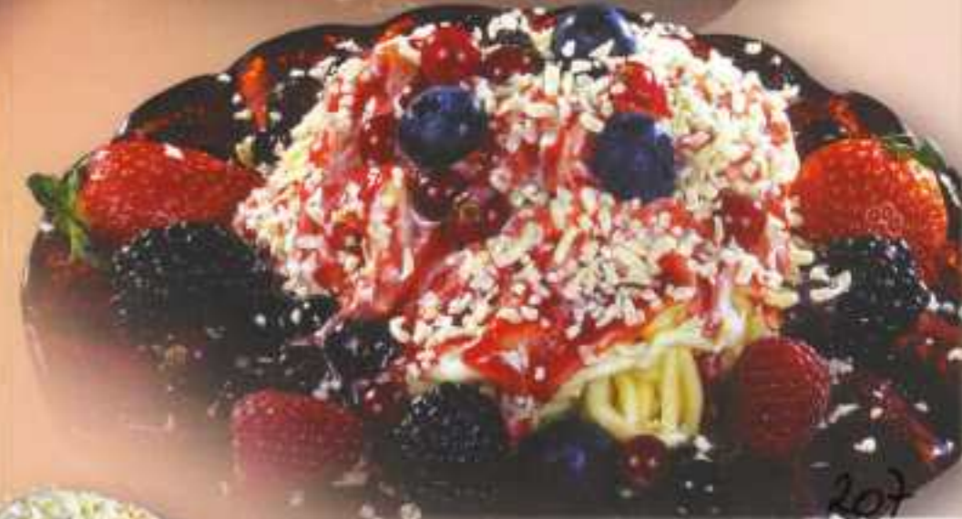
Waldfrüchte 207 Sahne, Vanilleeis, Erdbeersoße, weiße Schokoraspel und Waldfrüchte 8,00 €