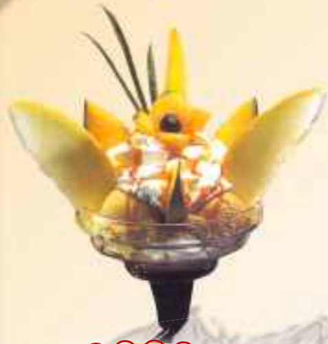
34. Melonen-Becher Gem. Eis, Melone Früchte, Sahne, und trop. Sauce 1-6 € 8,60