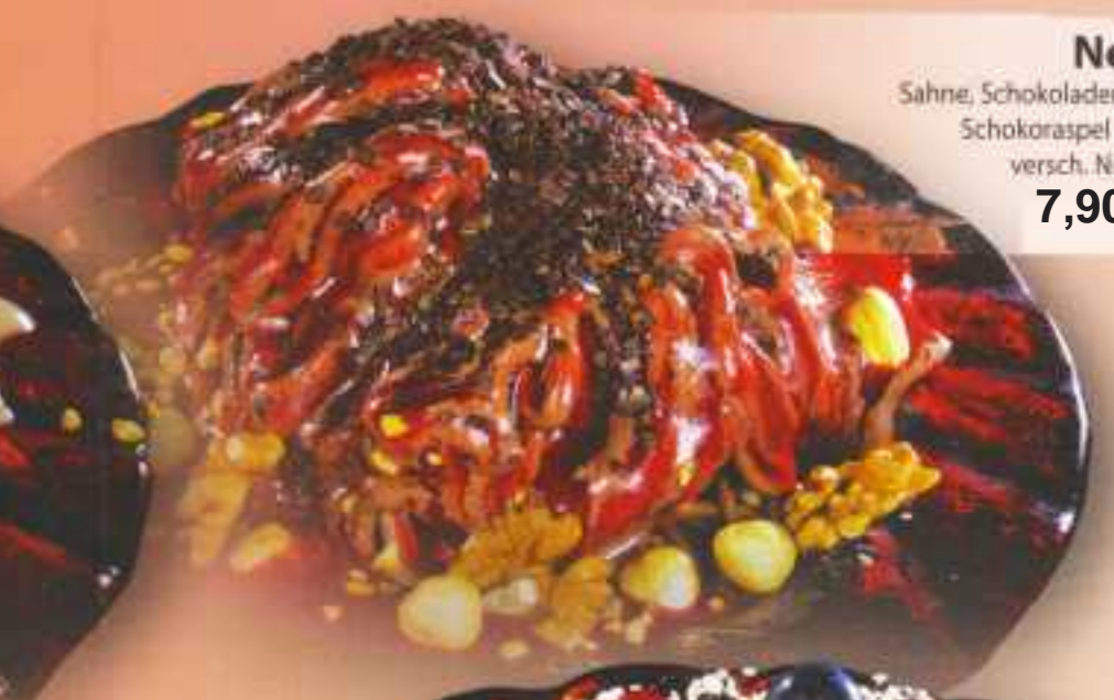
Neri Sahne, Schokoladeneis, Schokoraspel und versch. Nüsse 7,90 €