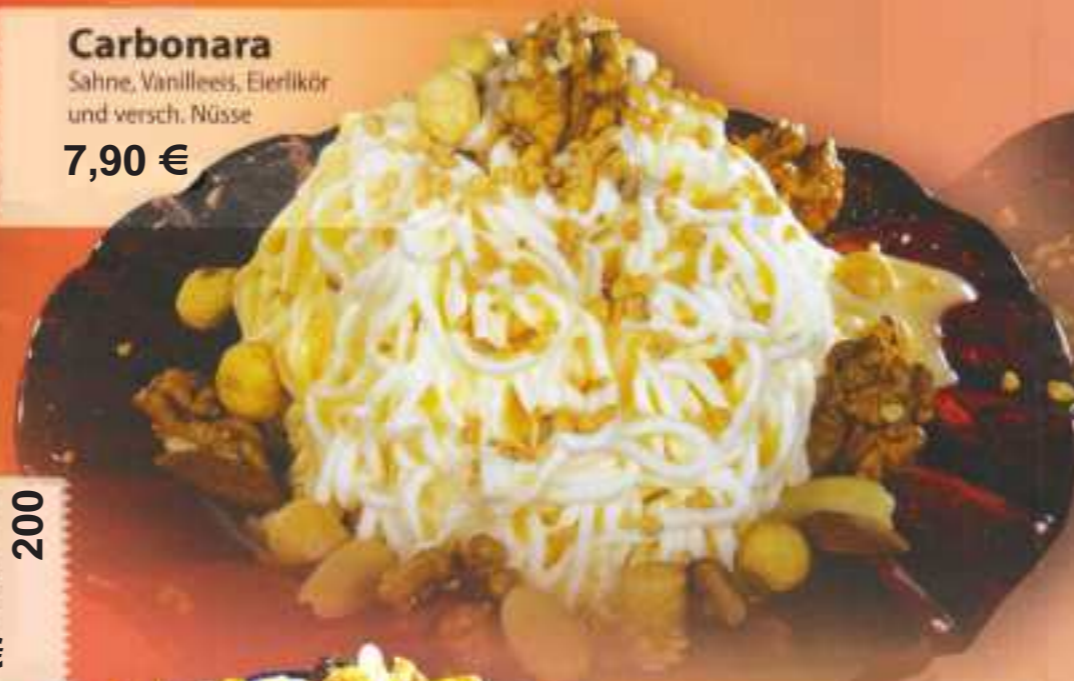
Carbonara Sahne, Vanilleeis, Eierlikör und versch. Nüsse 7,90 €