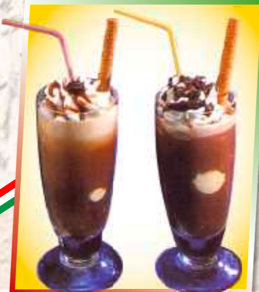
72. Eiskaffee 6,20 € Vanille-, Mokkaeis, kalter Kaffee, Sahne 1-2-6 73. Eisschokolade 6,20 € Vanille-, Schokoladeneis, kalter Kakao und Sahne 1-2-6