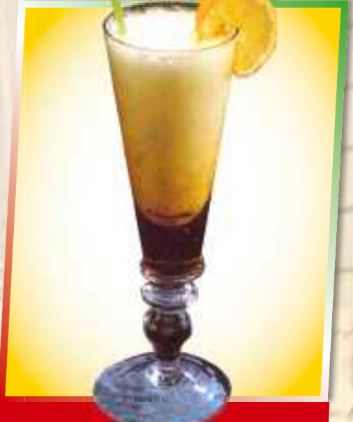
76. Sorbetto 7,50 € Zitroneneis mit Sekt 1-5-6