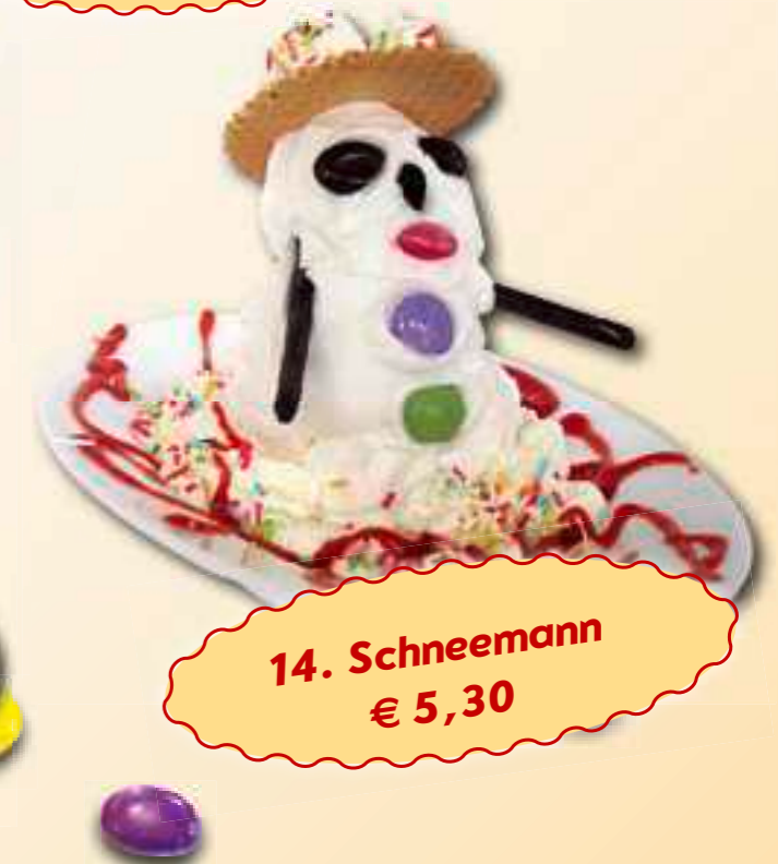
14. Schneemann € 5,30