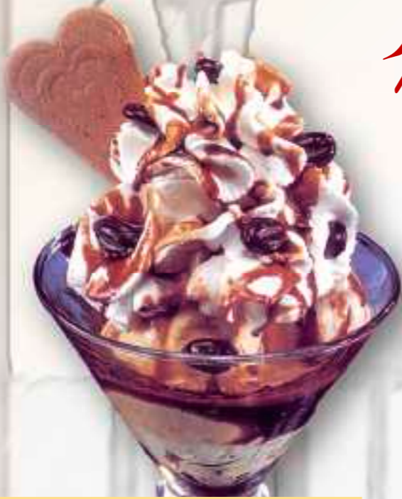
55. Mokka-Schale 8,00 € Vanille- und Mokkaeis, Mokkalikör, Sahne, und Mokkabohnen 1-5-2-6