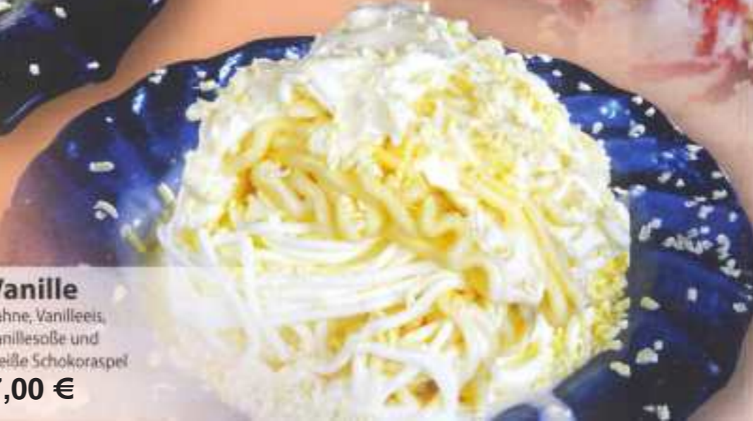
Vanille 205 Sahne, Vanilleeis, Vanillesoße und weiße Schokoraspel 7,00 €