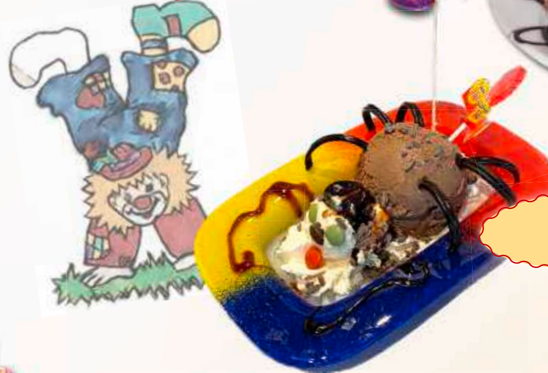
2. Spinne € 5,30