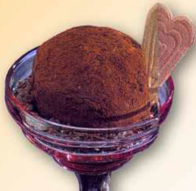
49. Tartufo 8,00 € große Vanille-, Schokoeiskugel, mit Schokolikör gefüllt, in Kakaopulver und Schokosplittter gerollt, mit Sahne. 1-5-6