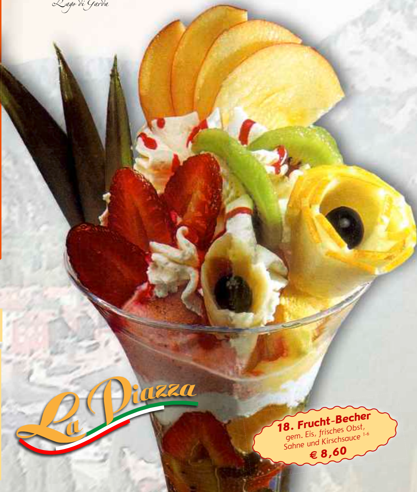
18. Frucht-Becher gem. Eis, frisches Obst, Sahne und Kirschsauce 1-6 € 8,60