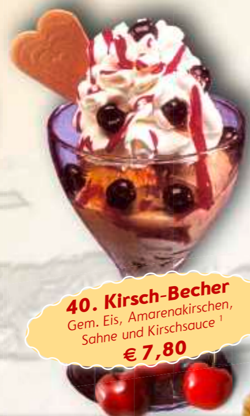
40. Kirsch-Becher Gem. Eis, Amarenakirschen, Sahne und Kirschsauce 1 € 7,80