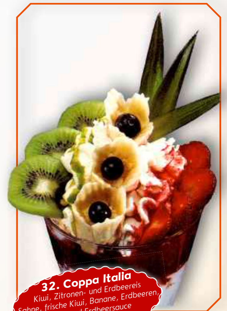
32. Coppa Italia Kiwi, Zitronen- und Erdbeereis Sahne, frische Kiwi, Banane, Erdbeeren, Kiwi- und Erdbeersauce € 8,80