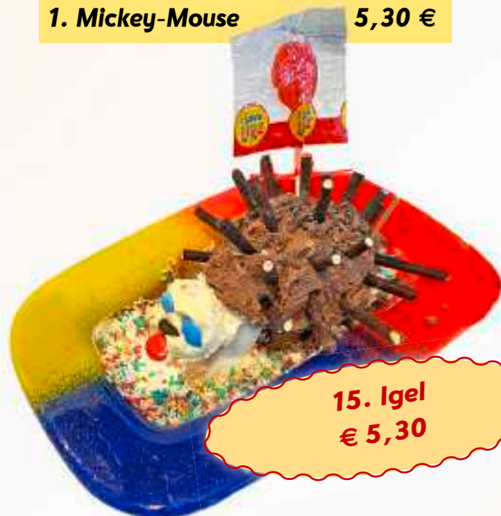
15. Igel € 5,30