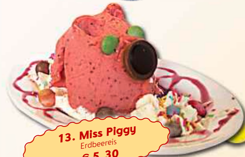
13. Miss Piggy Erdbeereis € 5,30