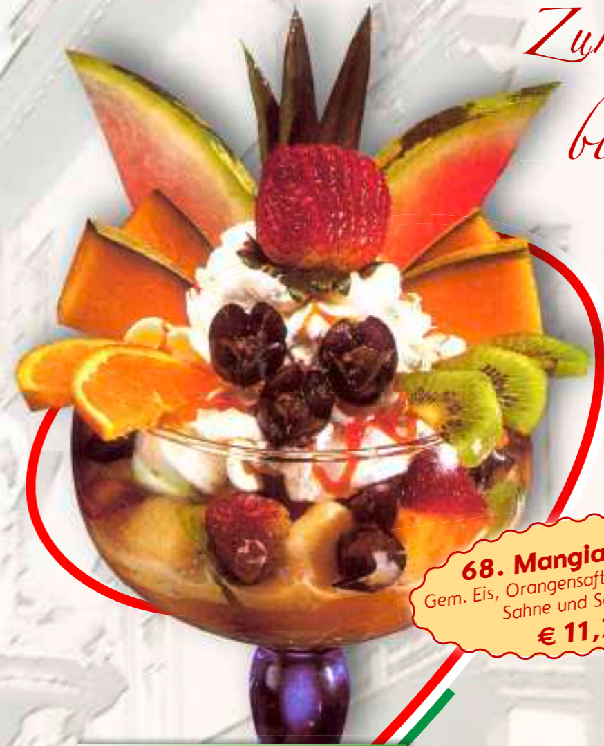
68. Mangia e Bevi Gem. Eis, Orangensaft, frische Früchte Sahne und Sauce 1-6 € 11,70