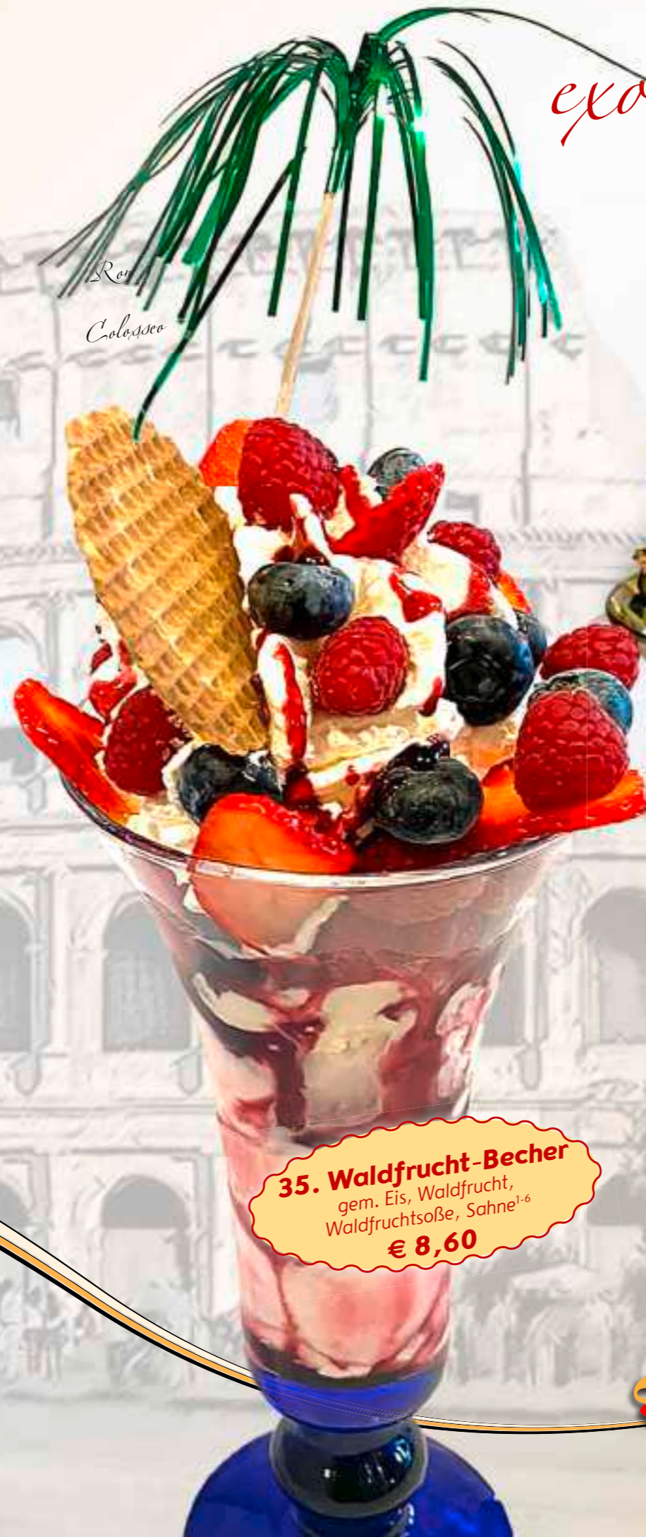
35. Waldfrucht-Becher gem. Eis, Waldfrucht, Waldfruchtsoße, Sahne 1-6 € 8,60