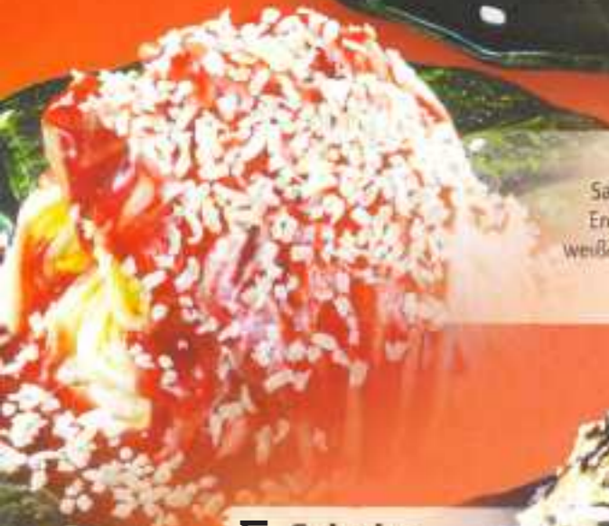
Eis 28 Sahne, Vanilleeis, Erdbeersoße und weiße Schokoraspel 7,00 €