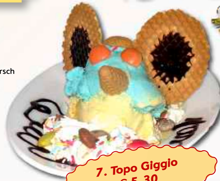
7. Topo Giggio € 5,30