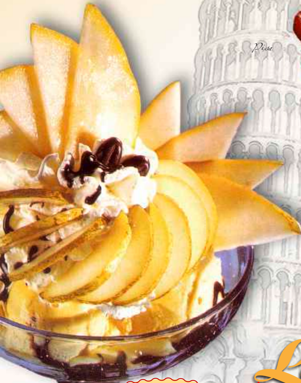
30. Birne Helene Vanilleeis, Birnen, Sahne und Schokolikör € 8,60