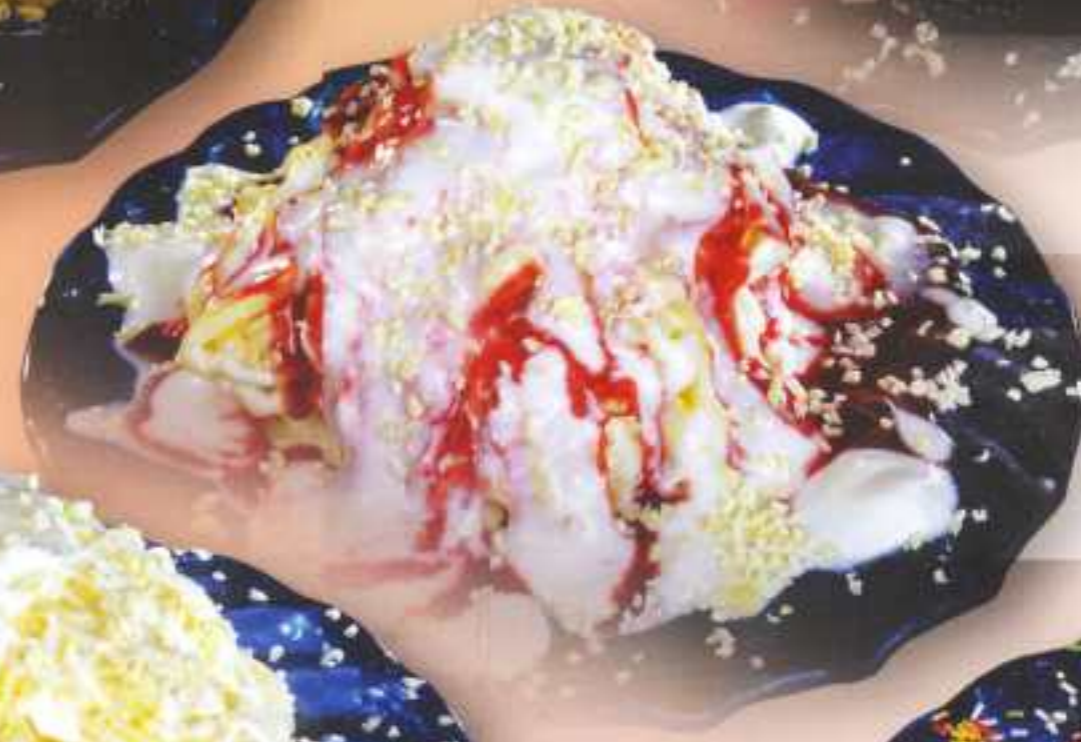
Joghurt 208 Sahne, Joghurteis, frischer Joghurt und weiße Schokoraspel 7,50 €