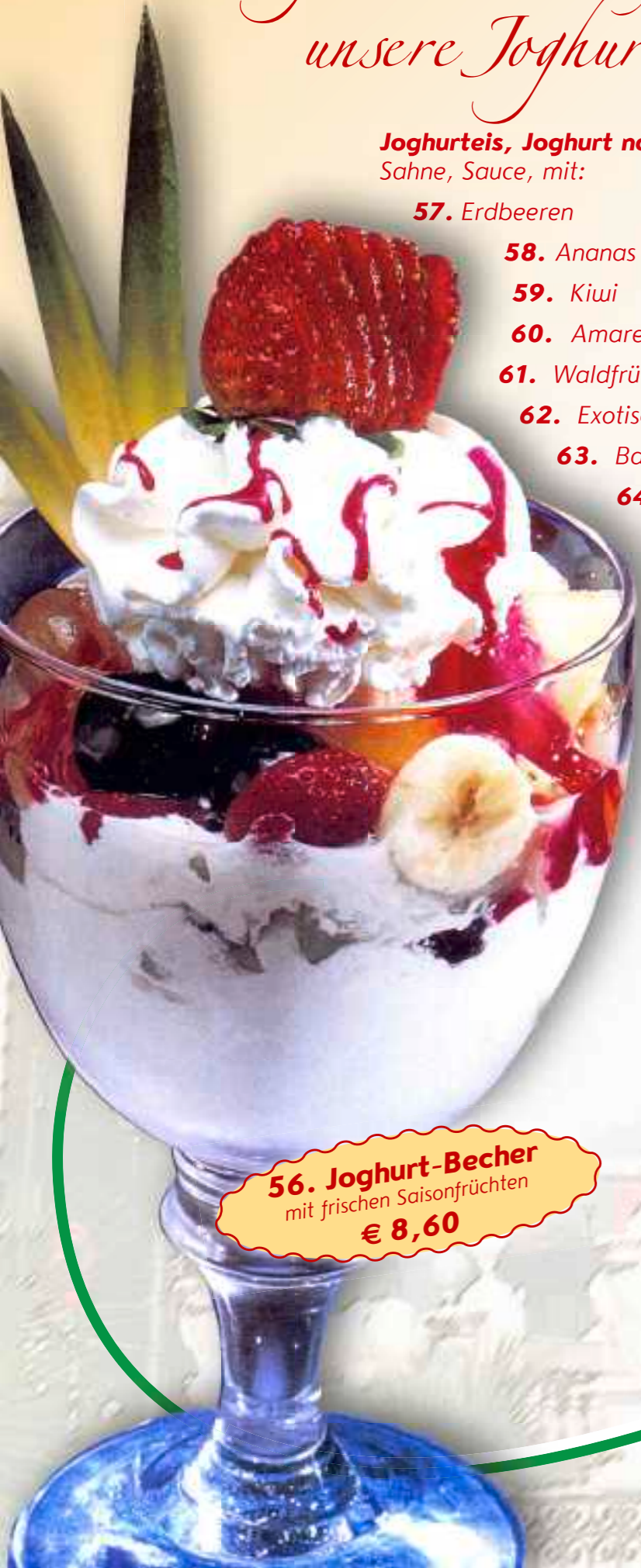
56. Joghurt-Becher mit frischen Saisonfrüchten € 8,60