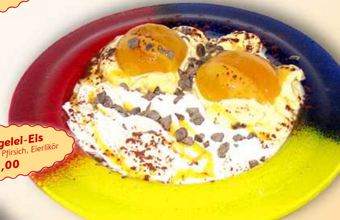
33. Spiegelei-Eis Vanilleeis, Sahne, Pfirsich, Eierlikör € 8,00