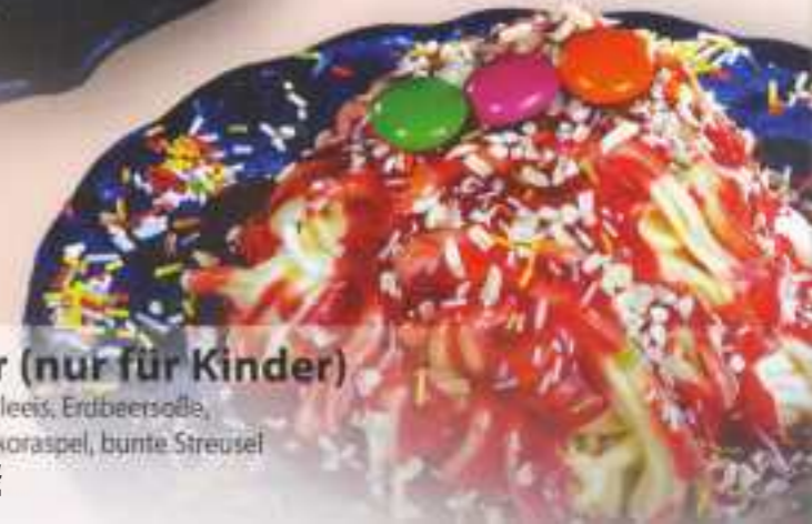
Kinder (nur für Kinder) 4 Sahne, Vanilleeis, Erdbeersoße, weiße Schokoraspel, bunte Streusel 5,40 €