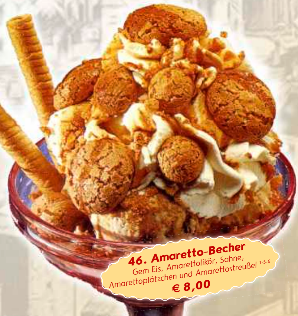
46. Amaretto-Becher Gem Eis, Amarettolikör, Sahne, Amarettopätzchen und Amarettostreusel 1-5-6 € 8,00