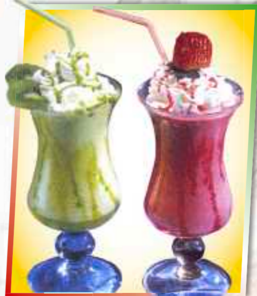
71. Joghurt-Frappè 6,50 € Großer Milchmix mit Früchteeissorten 1-6 nach Wahl, Naturjoghurt, Sahne + Sauce