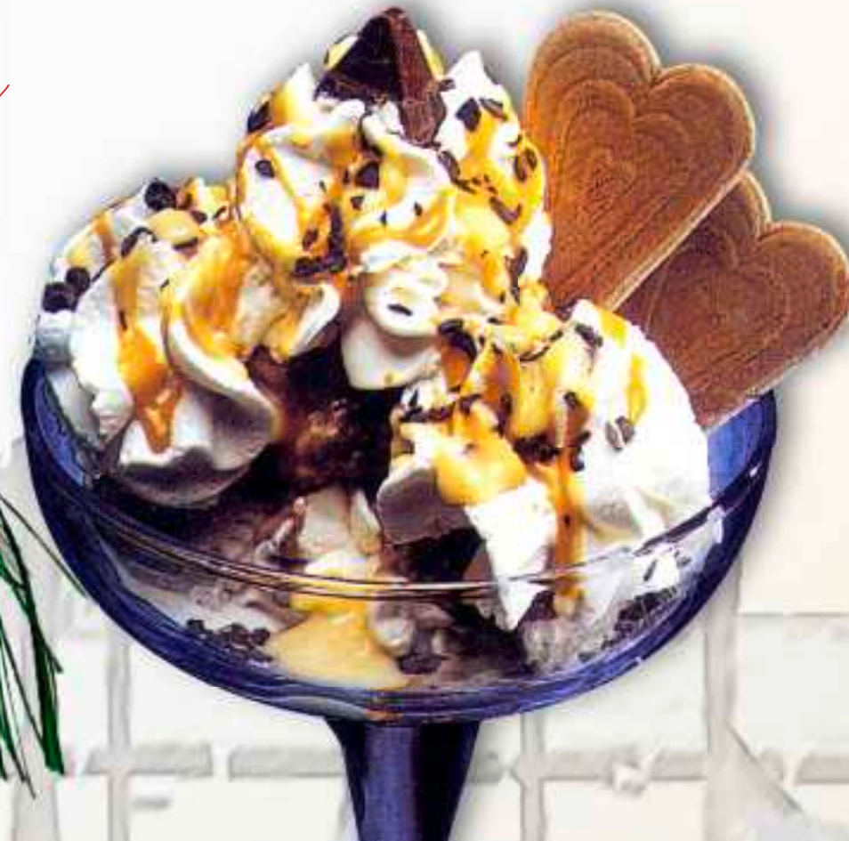
48. Eierlikör-Becher 8,00 € gem. Eis, Sahne, Eierlikör und Raspelschokolade 1-6