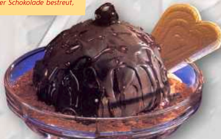
51. Mon Chery-Becher 8,00 € große Schoko-Nusseiskugel mit Cherry Brandy und Amarenakirsche gefüllt, mit Schokoguß überzogen, mit Sahne 1-5-6