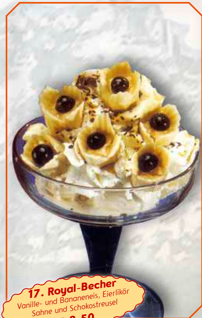
17. Royal-Becher Vanille- und Bananeneis, Eierlikör Sahne und Schokostreusel € 8,50