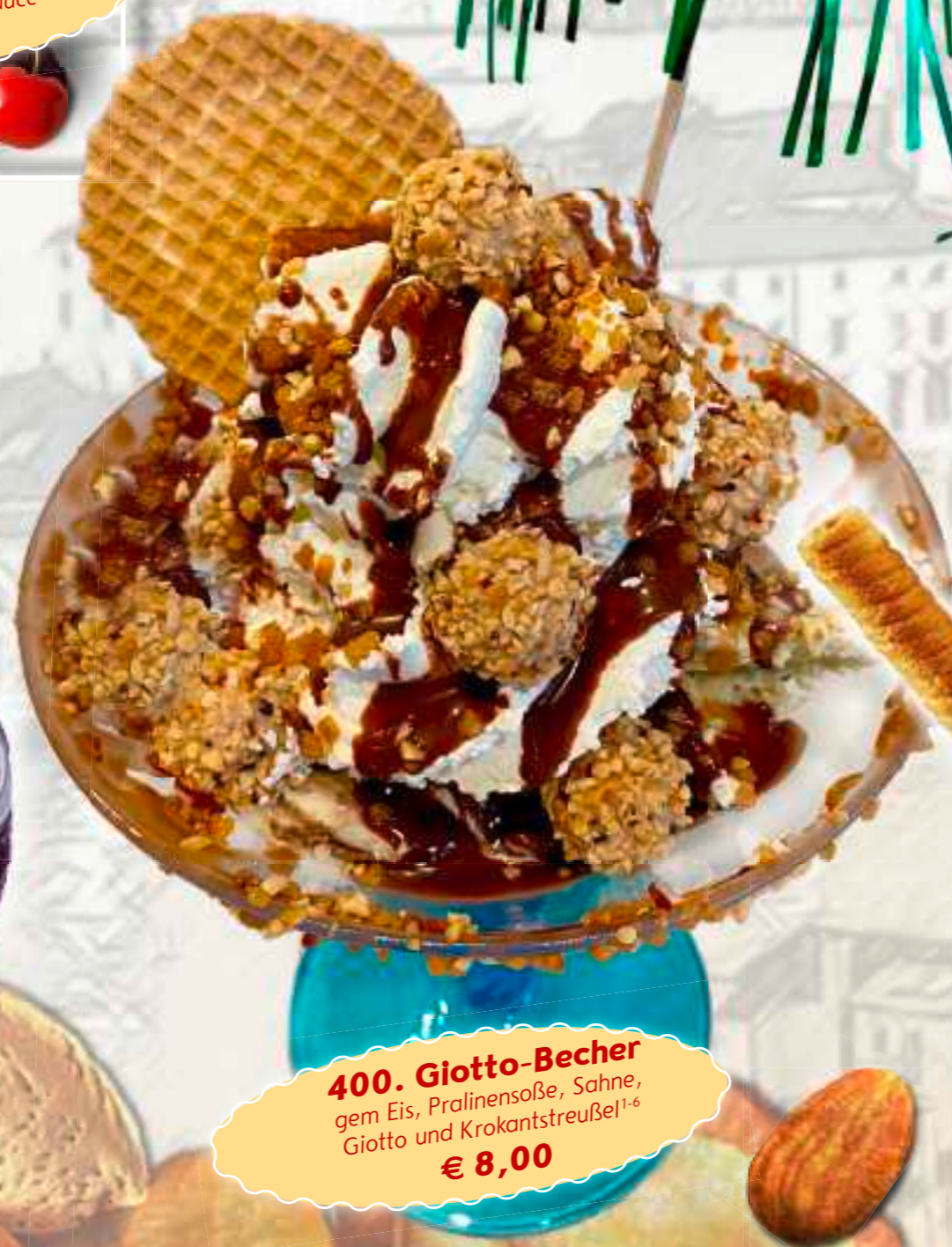
400. Giotto-Becher gem Eis, Pralinensoße, Sahne, Giotto und Krokantstreusel 1-6 € 8,00