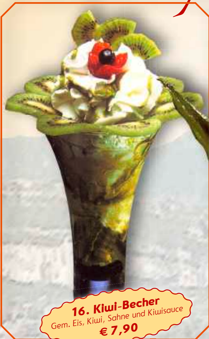
16. Kiwi-Becher Gem. Eis, Kiwi, Sahne und Kiwisauce € 7,90