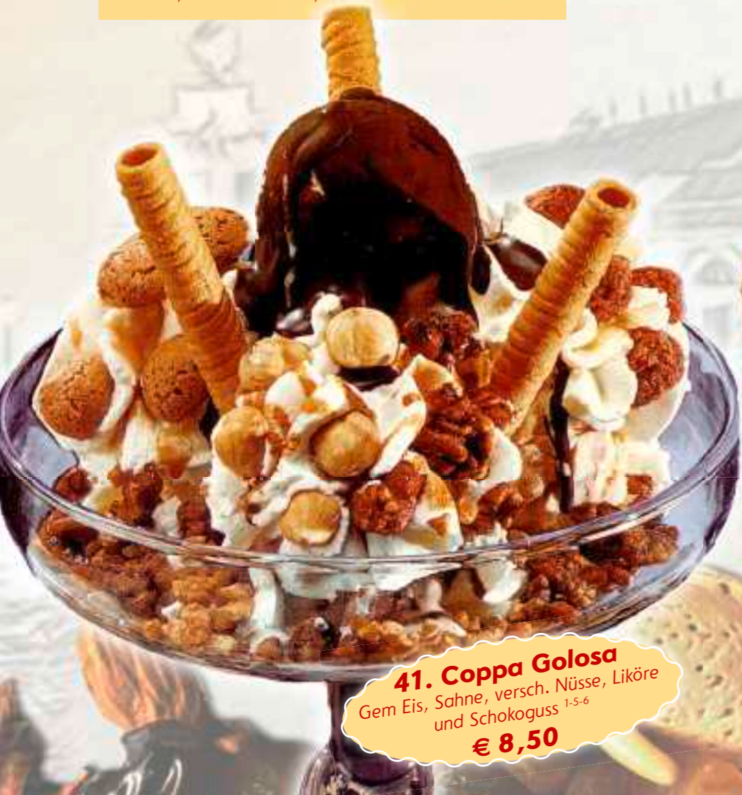
41. Coppa Golosa Gem Eis, Sahne, versch. Nüsse, Liköre und Schokoguss 1-5-6 € 8,50