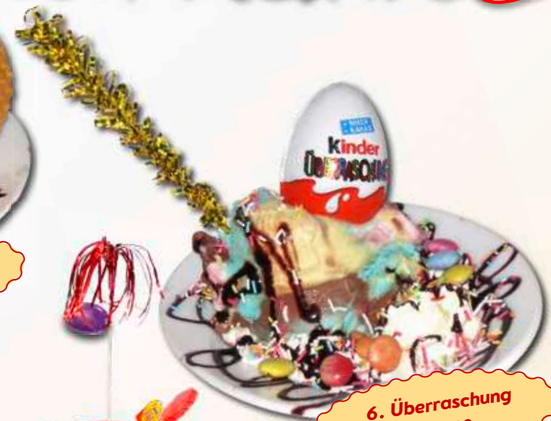
6. Überraschung € 6,40