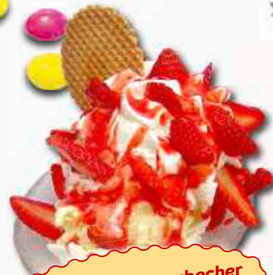
5. Kinder-Erdbeerbecher € 5,60