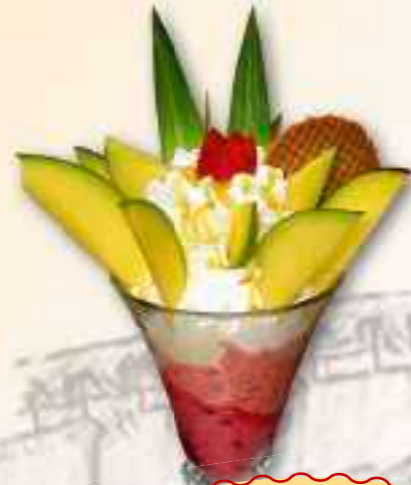
37. Mango-Becher Gem. Eis, Mango Früchte, Sahne, und trop. Sauce 1-6 € 8,60