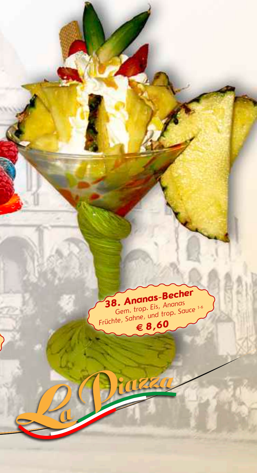
38. Ananas-Becher Gem. trop. Eis, Ananas Früchte, Sahne, und trop. Sauce 1-6 € 8,60