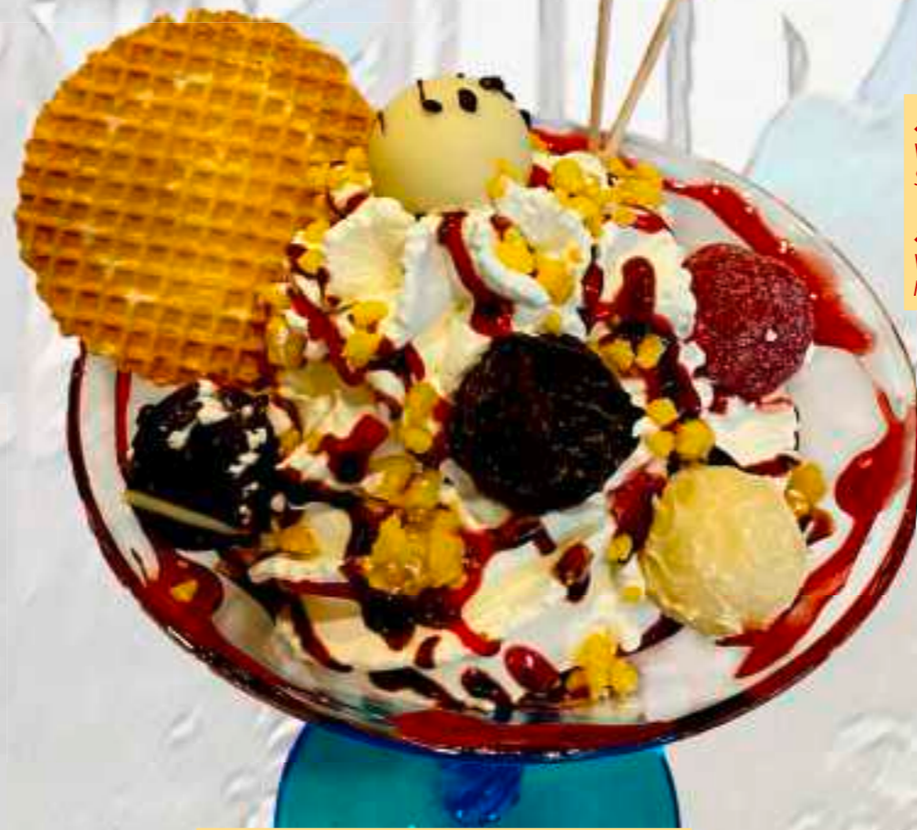
53. Praline-Becher 8,00 € gem. Eis, Sahne, Praline, BAM-Soße, Nusslikör, Zitronenstreusel 1-5-6