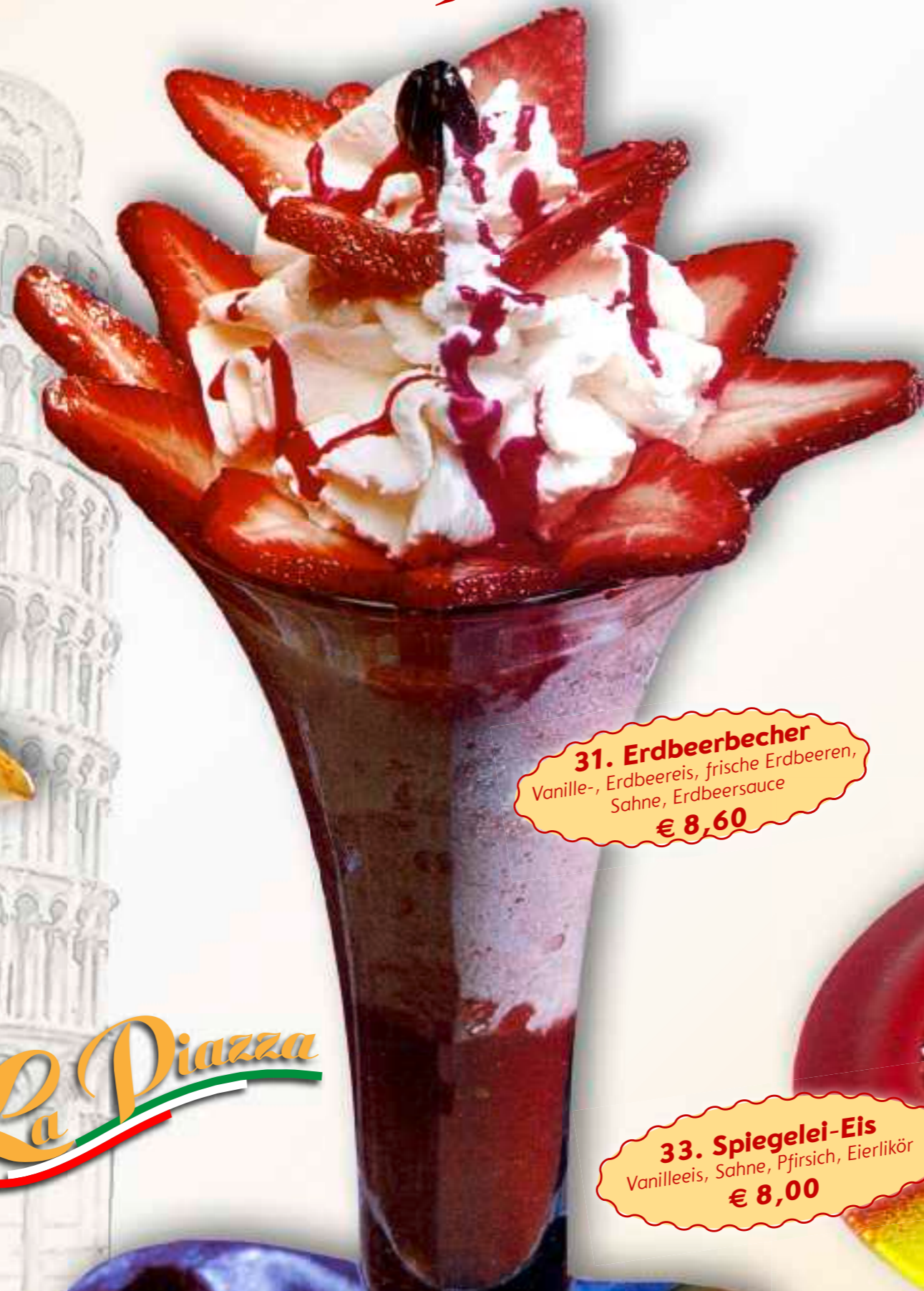
31. Erdbeerbecher Vanille-, Erdbeereis, frische Erdbeeren, Sahne, Erdbeersauce € 8,60