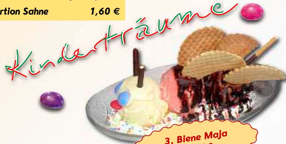
3. Biene Maja € 5,30