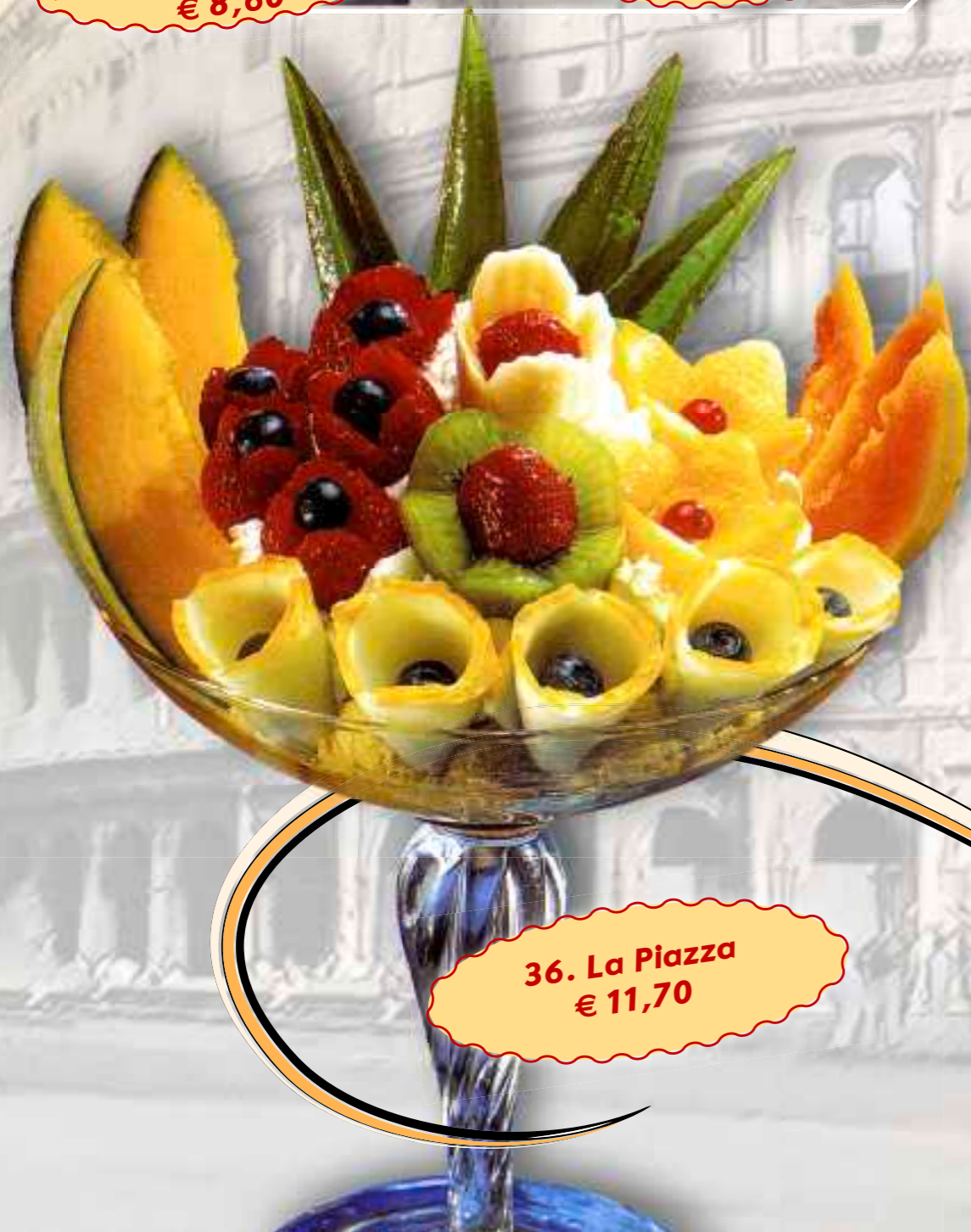
36. La Piazza € 11,70