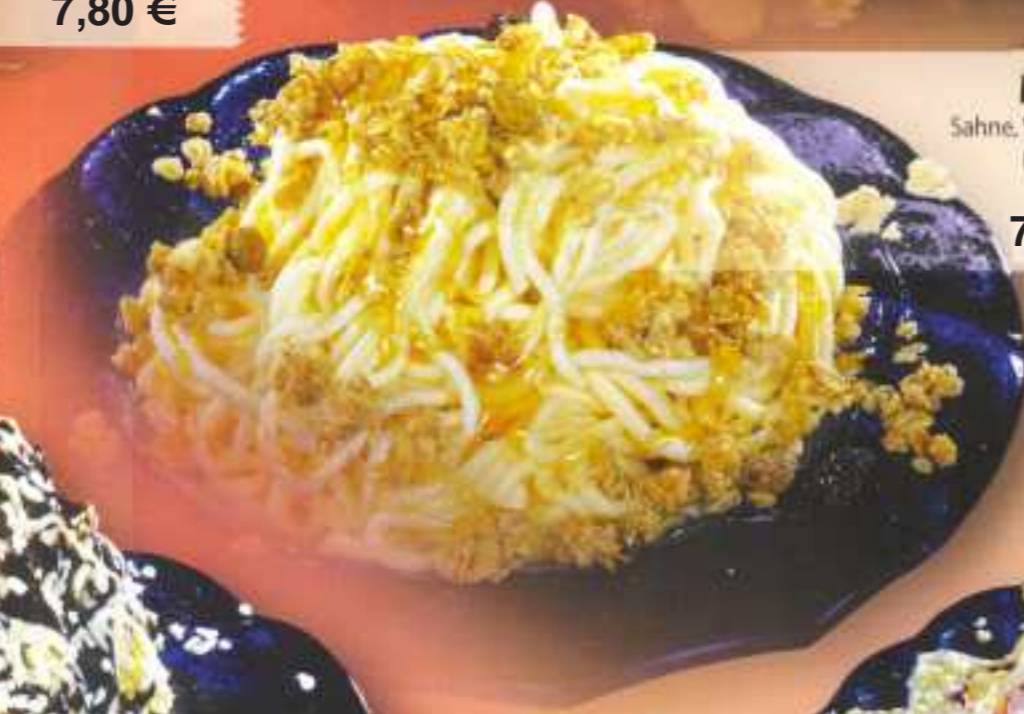
Müsli 204 Sahne, Vanilleeis, Müll und Honig 7,20 €