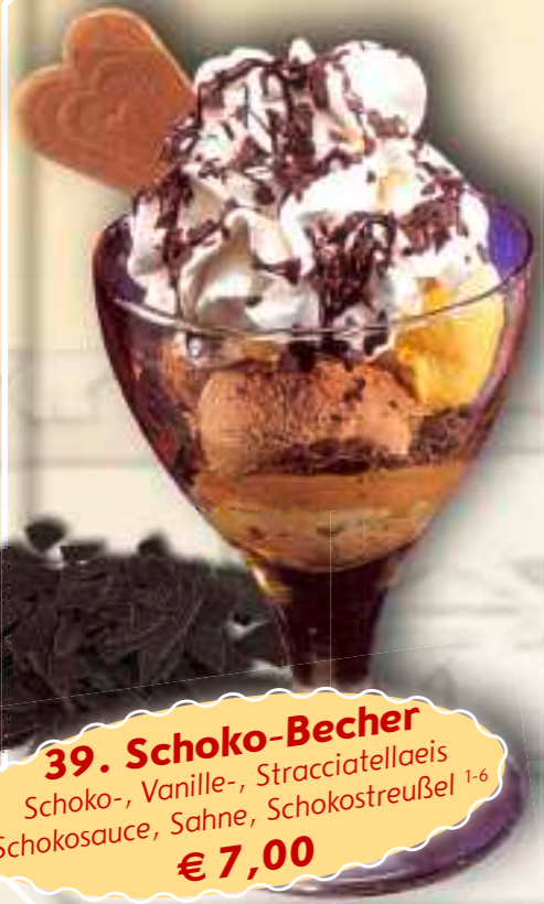
39. Schoko-Becher Schoko-, Vanille-, Stracciatellaeis Schokosauce, Sahne, Schokostreusel 1-6 € 7,00