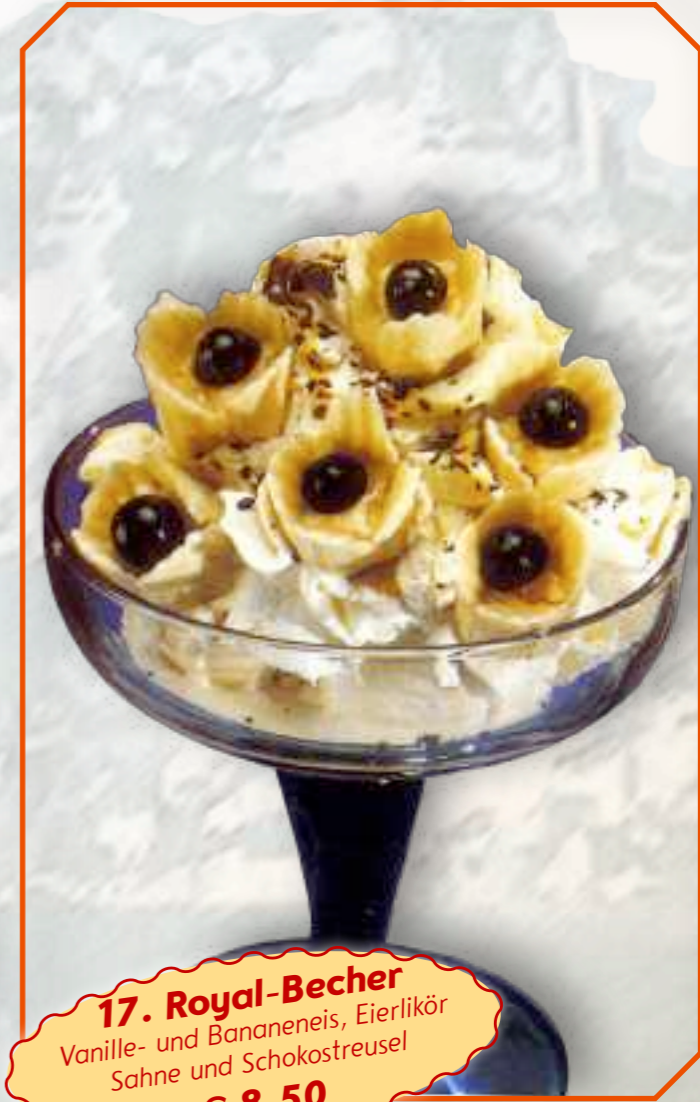
17. Royal-Becher Vanille- und Bananeneis, Eierlikör Sahne und Schokostreusel € 8,50