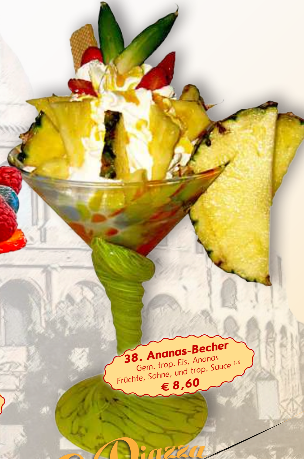
38. Ananas-Becher Gem. trop. Eis, Ananas Früchte, Sahne, und trop. Sauce 1-6 € 8,60