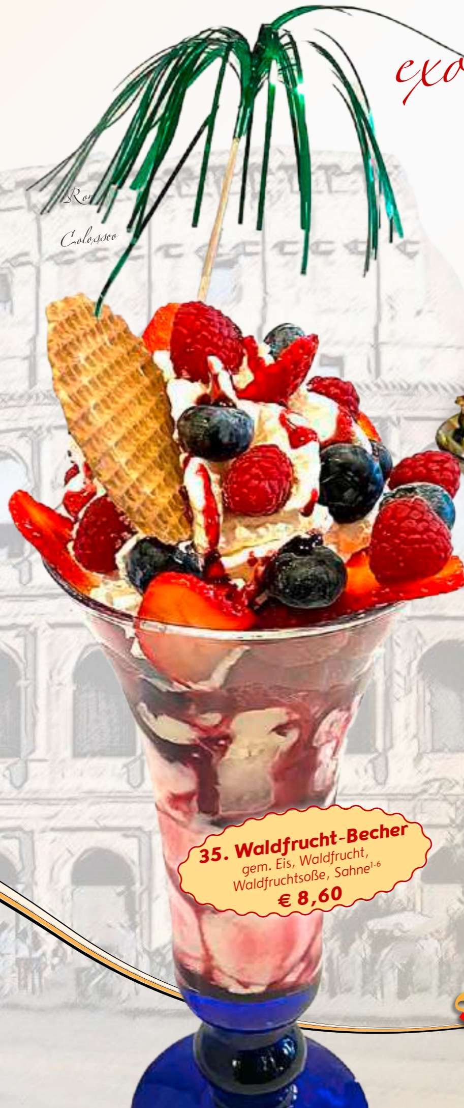
35. Waldfrucht-Becher gem. Eis, Waldfrucht, Waldfruchtsoße, Sahne 1-6 € 8,60