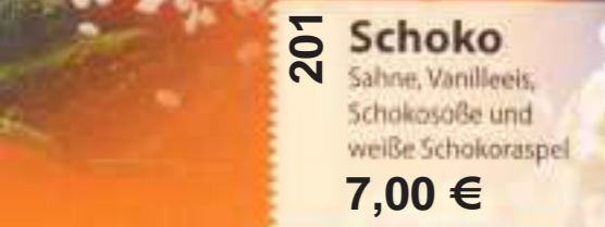
Schoko 201 Sahne, Vanilleeis, Schokosoße und weiße Schokoraspel 7,00 €