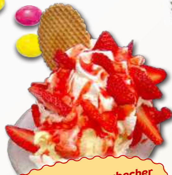
5. Kinder-Erdbeerbecher € 5,60