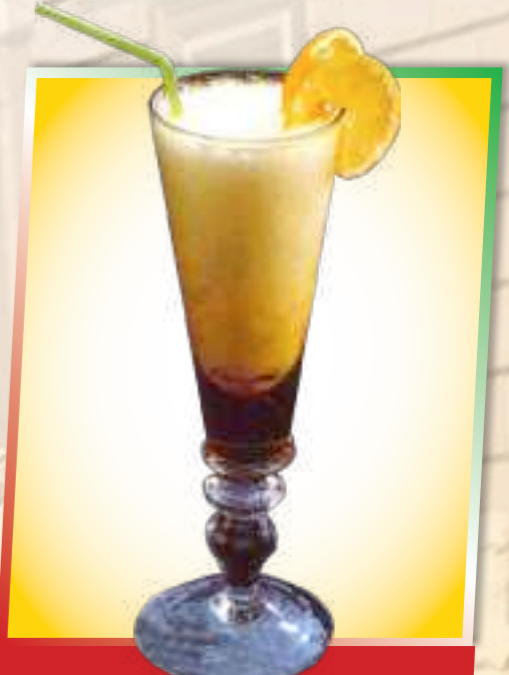
76. Sorbetto 7,50 € Zitroneneis mit Sekt 1-5-6