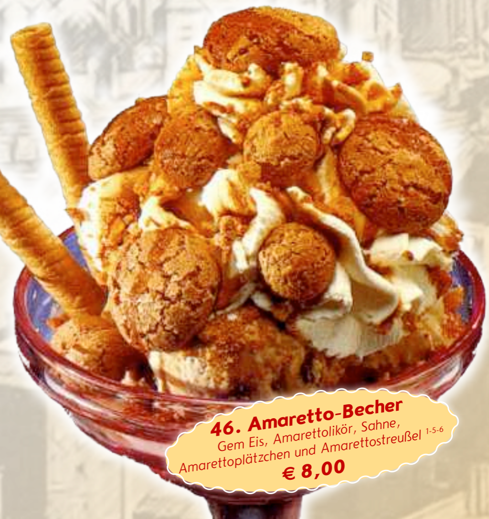
46. Amaretto-Becher Gem Eis, Amarettolikör, Sahne, Amarettopätzchen und Amarettostreufel 1-5-6 € 8,00