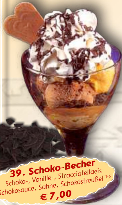
39. Schoko-Becher Schoko-, Vanille-, Stracciatellaeis Schokosauce, Sahne, Schokostreufel 1-6 € 7,00