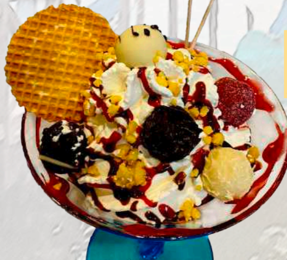
53. Praline-Becher 8,00 € gem. Eis, Sahne, Praline, BAM-Soße, Nusslikör, Zitronenstreusel 1-5-6