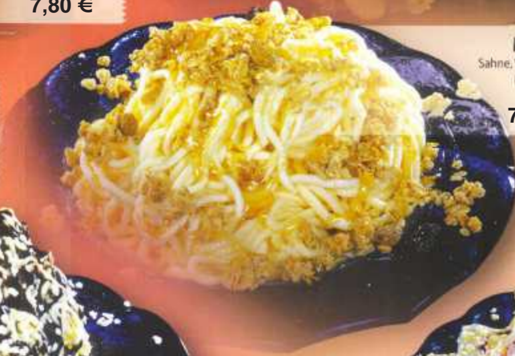
Müsli 204 Sahne, Vanilleeis, Müli und Honig 7,20 €