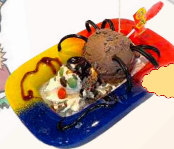
2. Spinne € 5,30