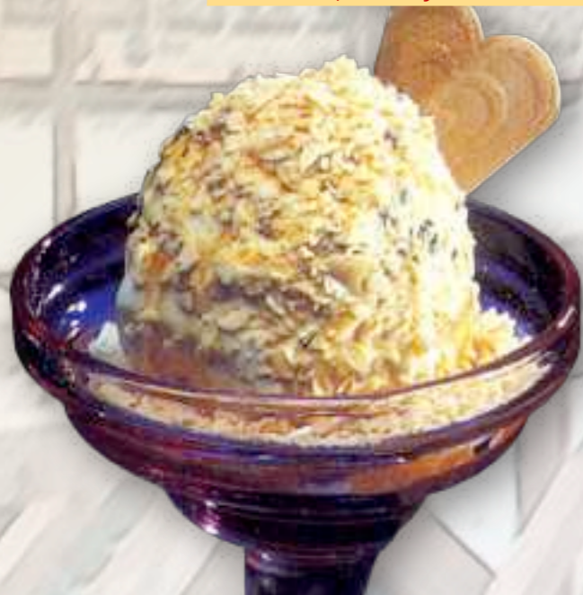
50. Raffaello 8,00 € große Vanille-, Stracciatellaeiskugel, mit Zabajonelikör gefüllt, Vanillesauce, übergossen und weißer Schokolade bestreut, mit Sahne 1-5-6