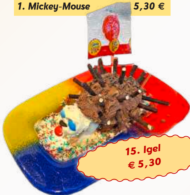
15. Igel € 5,30