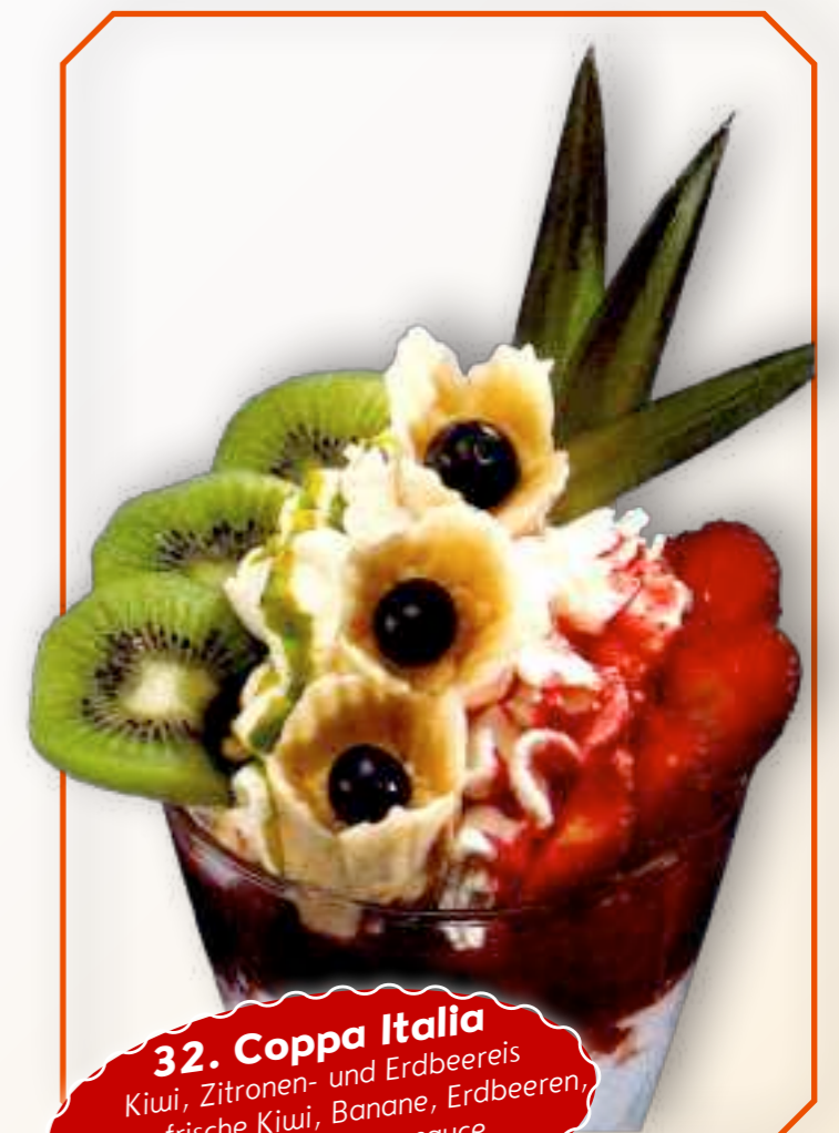
32. Coppa Italia Kiwi, Zitronen- und Erdbeereis Sahne, frische Kiwi, Banane, Erdbeeren, Kiwi- und Erdbeersauce € 8,80