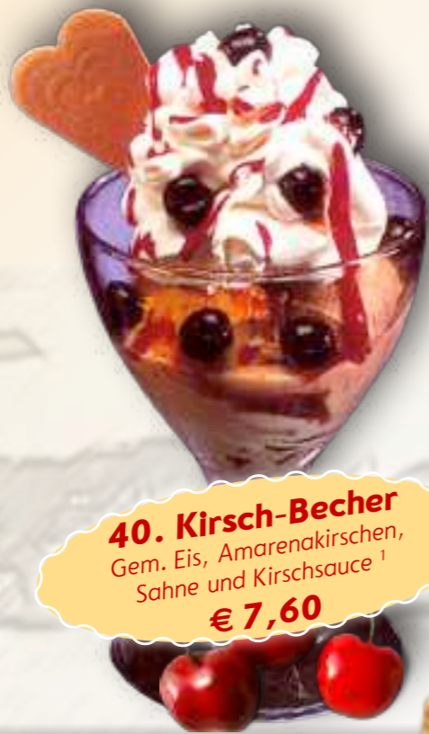
40. Kirsch-Becher Gem. Eis, Amarenakirschen, Sahne und Kirschsauce 1 € 7,60