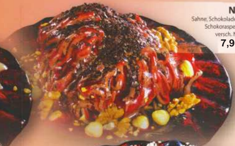
Neri Sahne, Schokoladeneis, Schokoraspel und versch. Nüsse 7,90 €