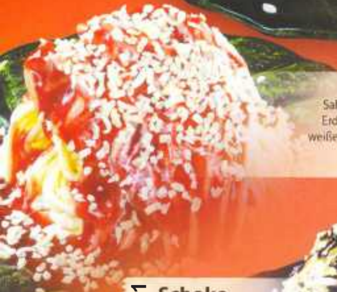
Eis 28 Sahne, Vanilleeis, Erdbeersoße und weiße Schokoraspel 7,00 €