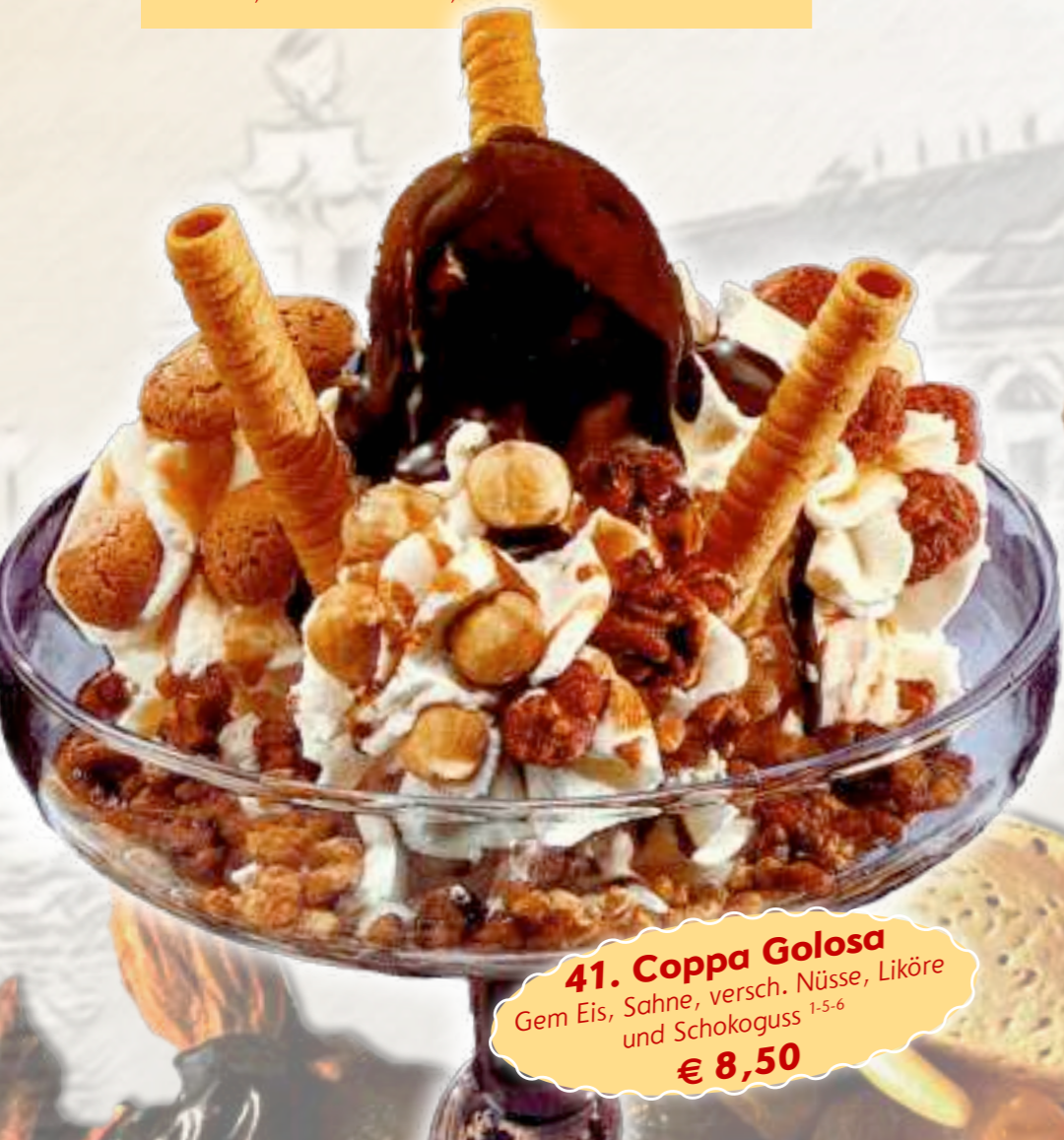
41. Coppa Golosa Gem Eis, Sahne, versch. Nüsse, Liköre und Schokoguss 1-5-6 € 8,50