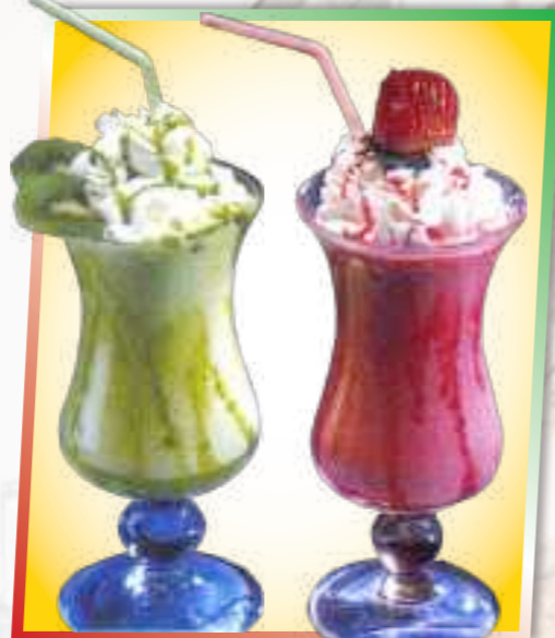
71. Joghurt-Frappè 6,50 € Großer Milchmix mit Früchteisorten 1-6 nach Wahl, Naturjoghurt, Sahne + Sauce