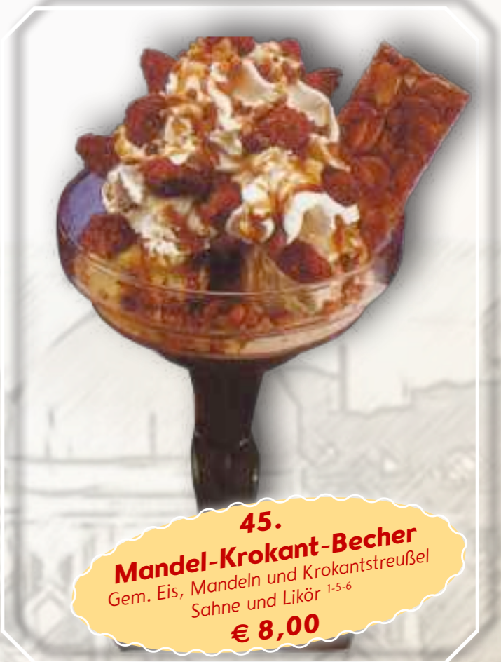
45. Mandel-Krokant-Becher Gem. Eis, Mandeln und Krokantstreufel Sahne und Likör 1-5-6 € 8,00