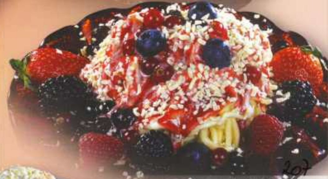
Waldfrüchte 207 Sahne, Vanilleeis, Erdbeersoße, weiße Schokoraspel und Waldfrüchte 8,00 €