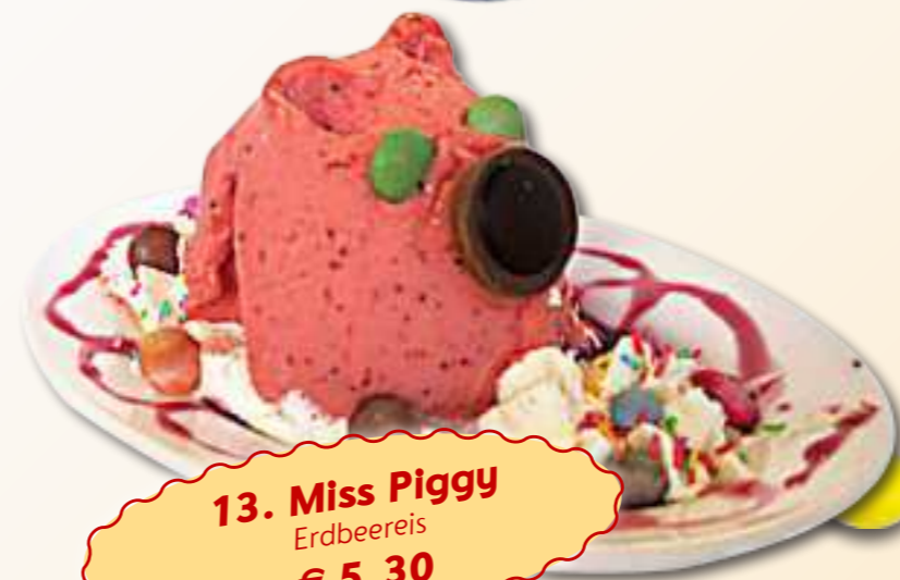
13. Miss Piggy Erdbeereis € 5,30