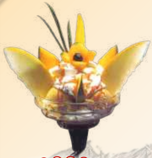
34. Melonen-Becher Gem. Eis, Melone Früchte, Sahne, und trop. Sauce 1-6 € 8,60