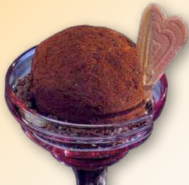
49. Tartufo 8,00 € große Vanille-, Schokoeiskugel, mit Schokolikör gefüllt, in Kakaopulver und Schokosplitterer gerollt, mit Sahne. 1-5-6