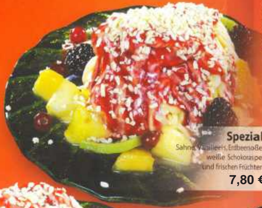
Spezial 200 Sahne, Vanilleeis, Erdbeersoße, weiße Schokoraspel und frischen Früchten 7,80 €