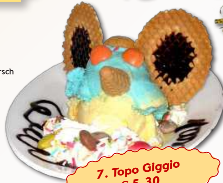
7. Topo Giggio € 5,30