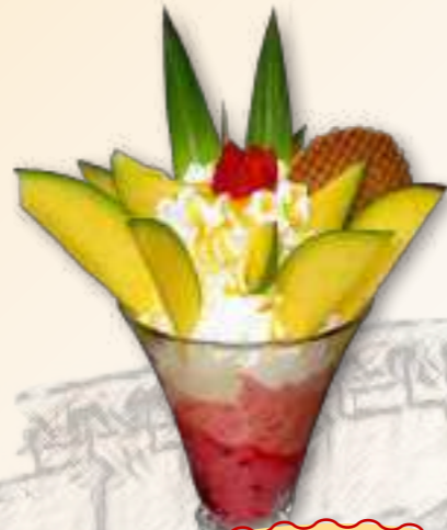
37. Mango-Becher Gem. Eis, Mango Früchte, Sahne, und trop. Sauce 1-6 € 8,60