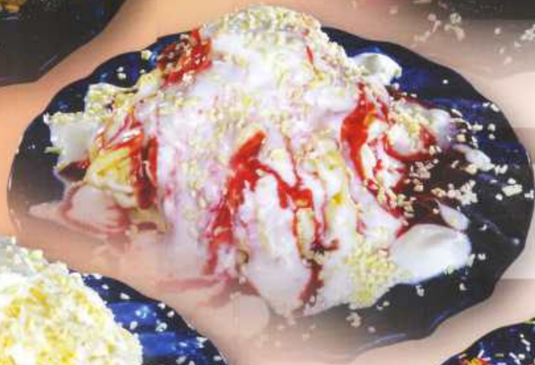
Joghurt 208 Sahne, Joghurt, eis, frischer Joghurt und weiße Schokoraspel 7,50 €