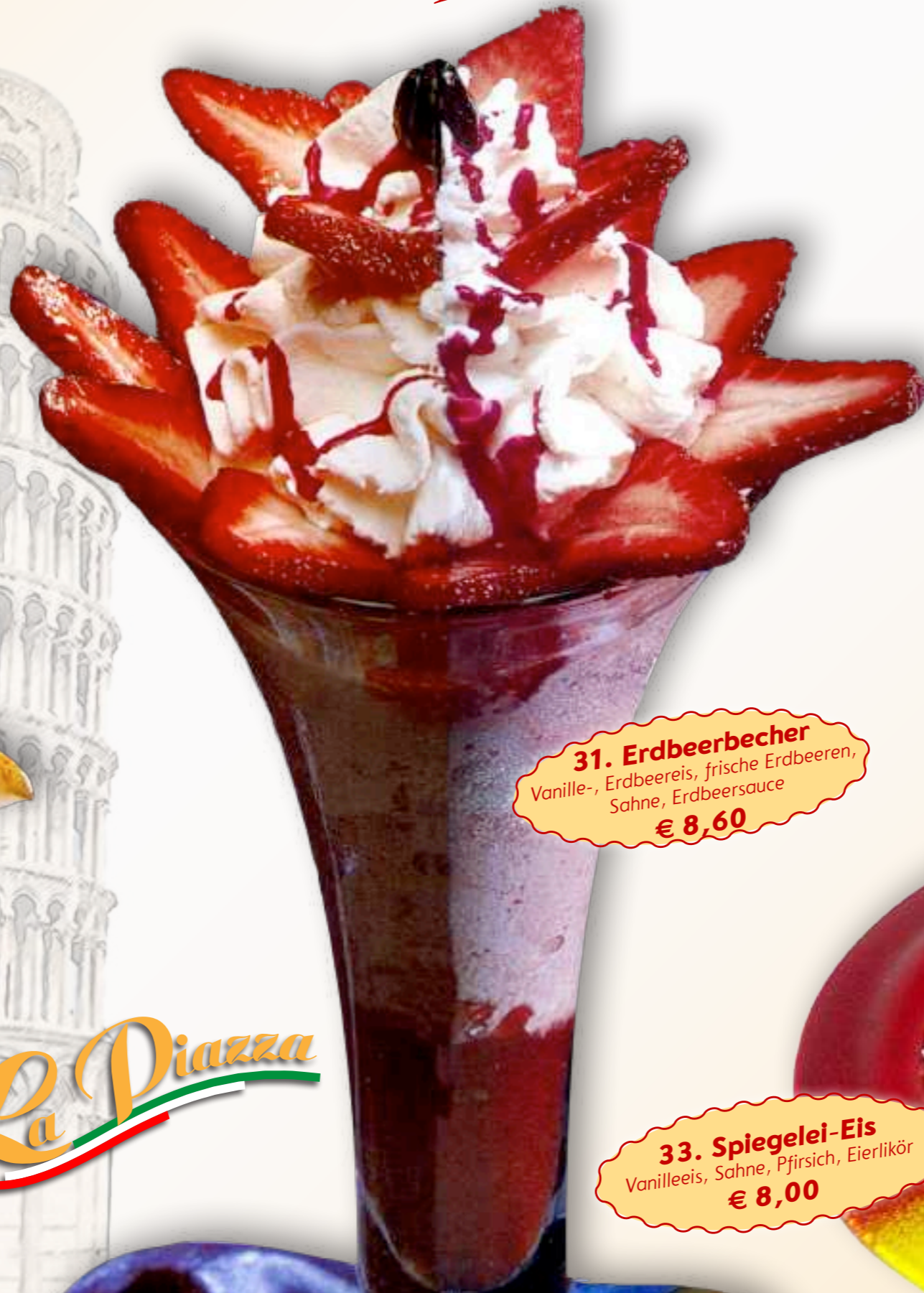
31. Erdbeerbecher Vanille-, Erdbeereis, frische Erdbeeren, Sahne, Erdbeersauce € 8,60