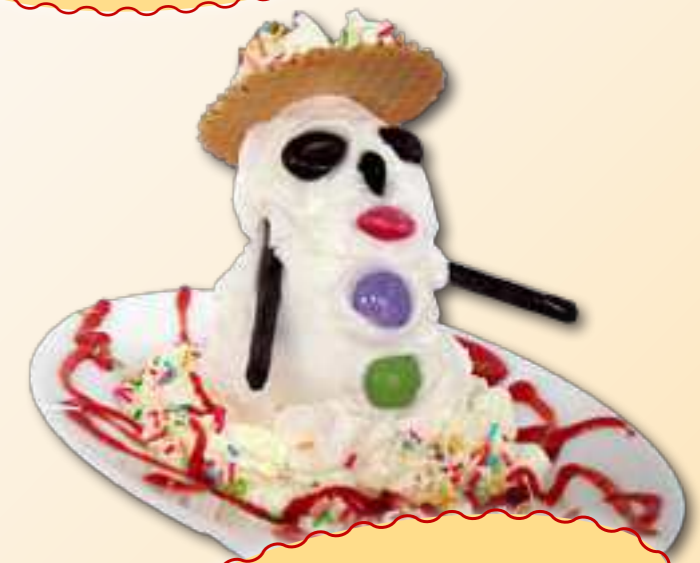
14. Schneemann € 5,30