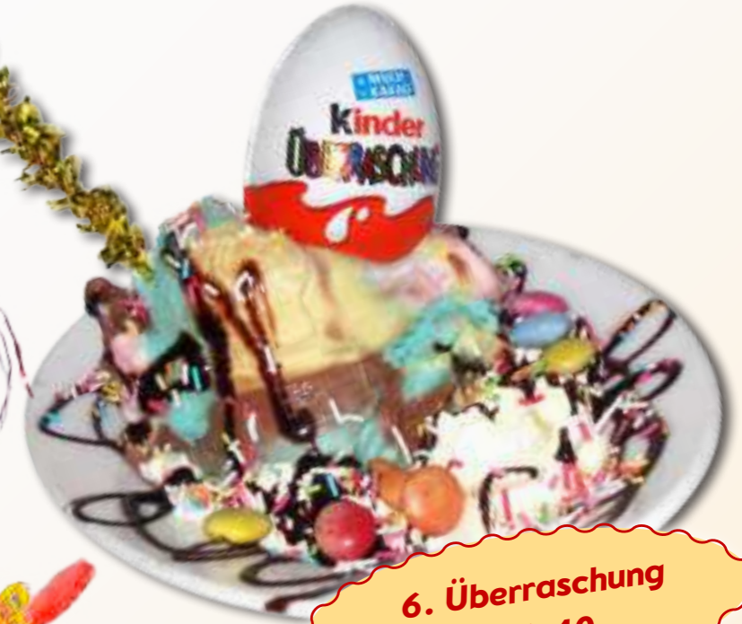
6. Überraschung € 6,40