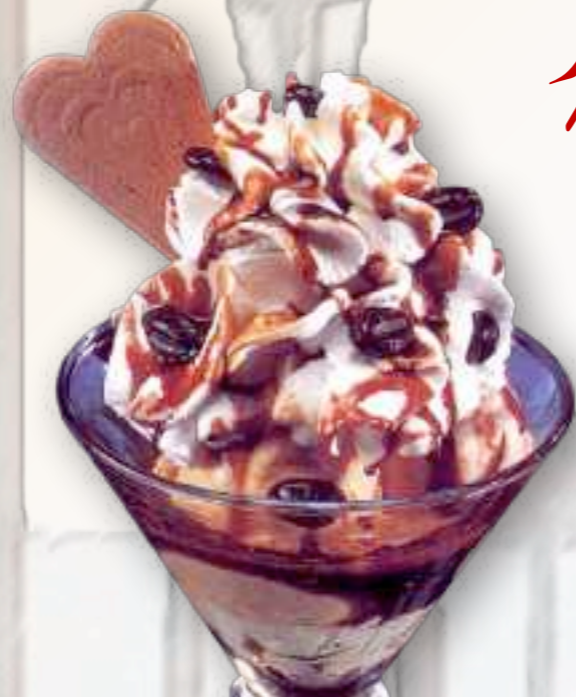
55. Mokka-Schale 8,00 € Vanille- und Mokkaeis, Mokkalikör, Sahne, und Mokkabohnen 1-5-2-6