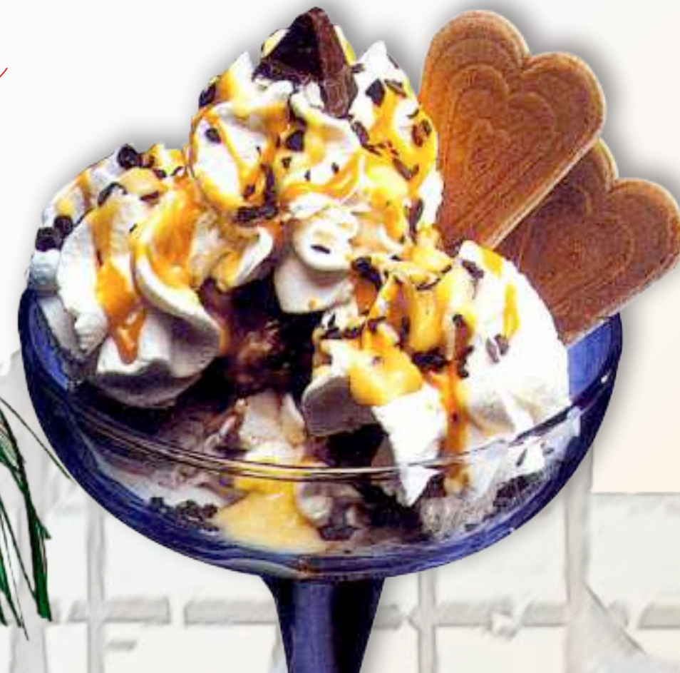
48. Eierlikör-Becher 8,00 € gem. Eis, Sahne, Eierlikör und Raspelschokolade 1-6