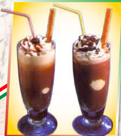
72. Eiskaffee 6,20 € Vanille-, Mokkacis, kalter Kaffee, Sahne 1-2-6 73. Eisschokolade 6,20 € Vanille-, Schokoladeneis, kalter Kakao und Sahne 1-2-6