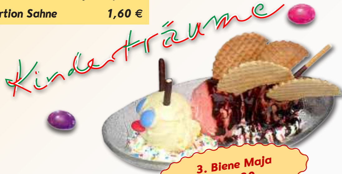
3. Biene Maja € 5,30