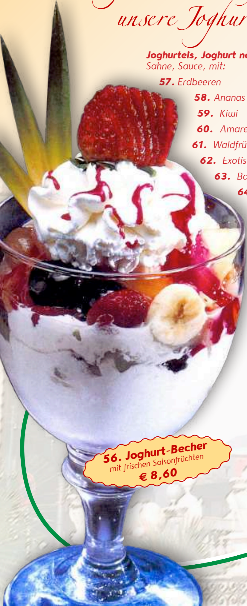
56. Joghurt-Becher mit frischen Saisonfrüchten € 8,60