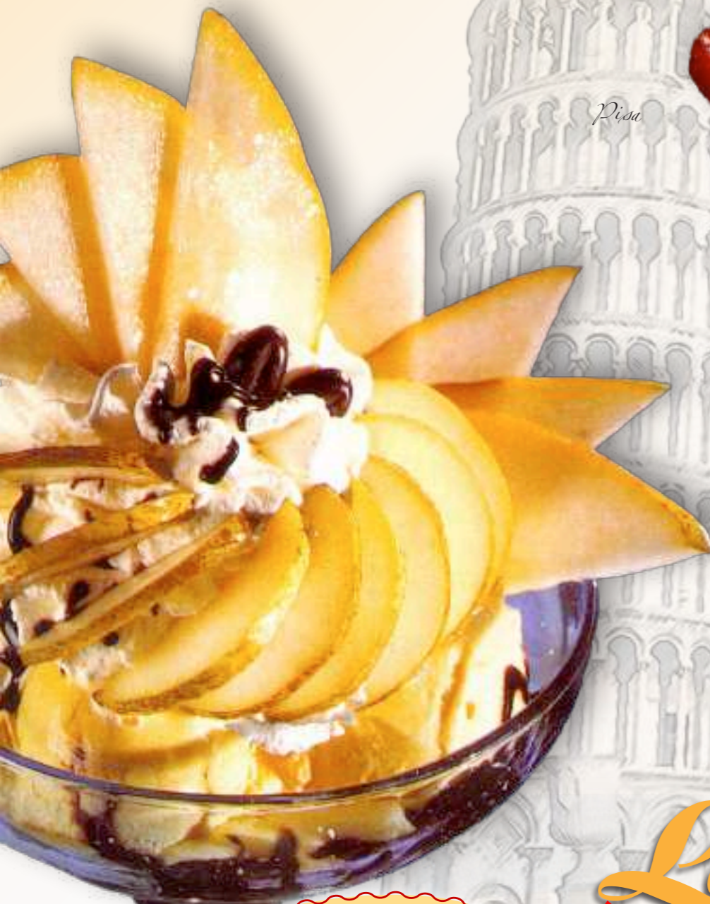
30. Birne Helene Vanilleeis, Birnen, Sahne und Schokolikör € 8,60