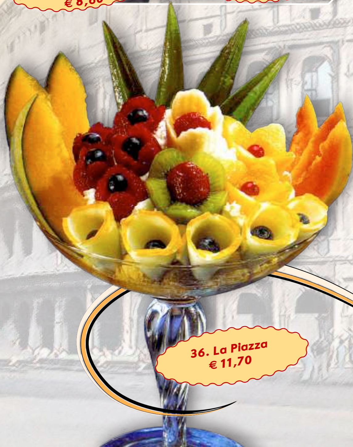
36. La Piazza € 11,70