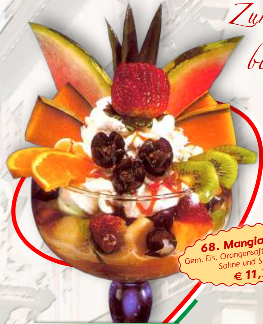
68. Mangia e Bevi Gem. Eis, Orangensaft, frische Früchte Sahne und Sauce 1-6 € 11,70