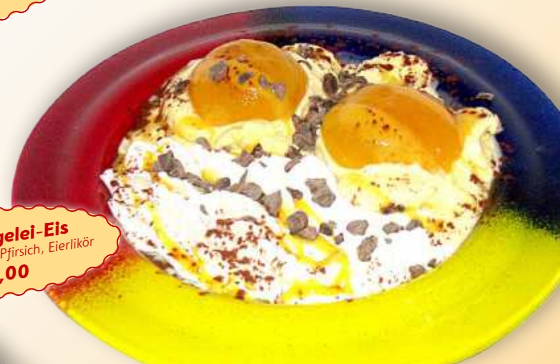
33. Spiegelei-Eis Vanilleeis, Sahne, Pfirsich, Eierlikör € 8,00