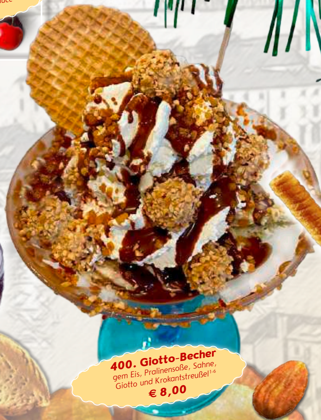
400. Giotto-Becher gem Eis, Pralinensoße, Sahne, Giotto und Krokantstreufel 1-6 € 8,00