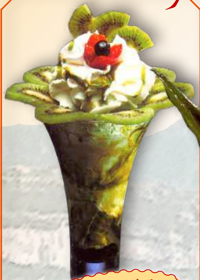
16. Kiwi-Becher Gem. Eis, Kiwi, Sahne und Kiwisauce € 7,90