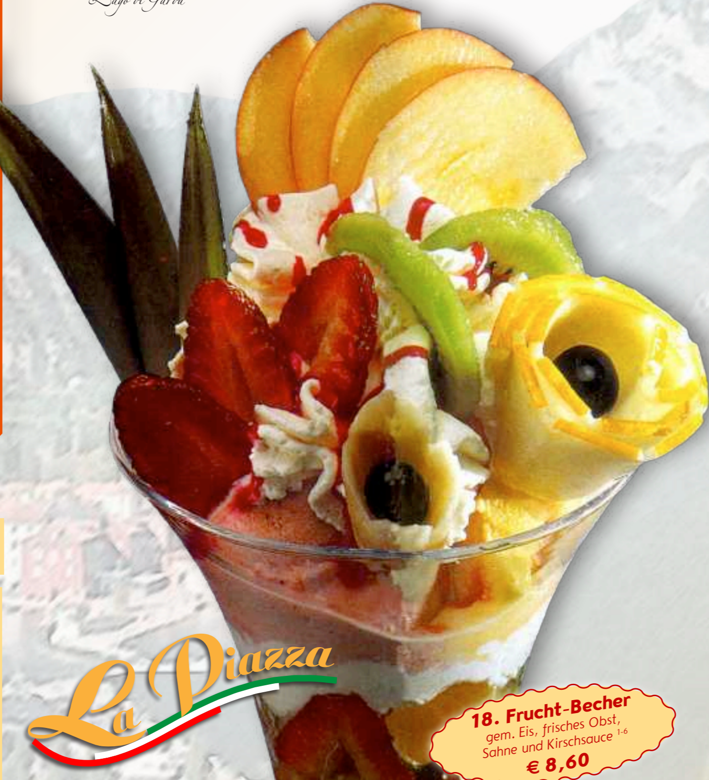
18. Frucht-Becher gem. Eis, frisches Obst, Sahne und Kirschsauce 1-6 € 8,60