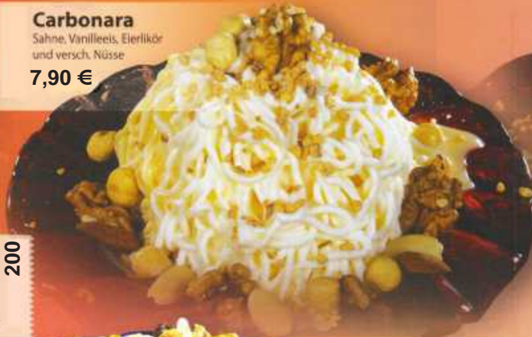
Carbonara Sahne, Vanilleeis, Eierlikör und versch. Nüsse 7,90 €