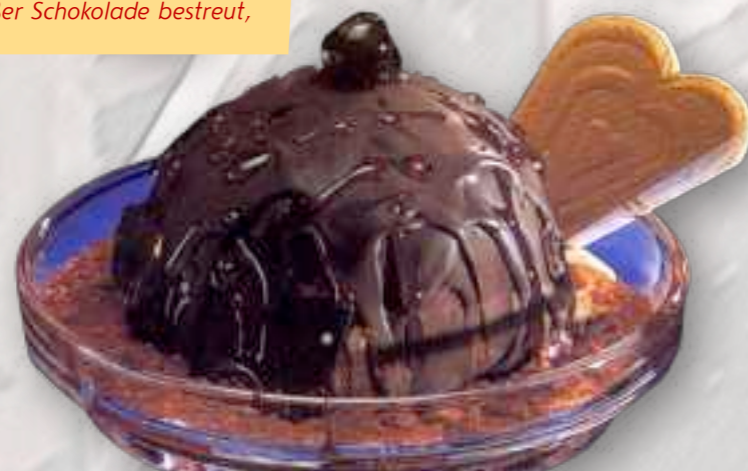
51. Mon Chery-Becher 8,00 € große Schoko-Nusseiskugel mit Cherry Brandy und Amarenakirsche gefüllt, mit Schokoguß überzogen, mit Sahne 1-5-6